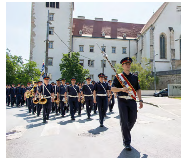
Die Polizeimusik Niederösterreich spielt am Mittwoch, 5. Juni, um 18.30 Uhr am Hauptplatz – Eintritt frei!

Das Konzert in Freistadt ist Teil des Polizeimusikfestivals von 4. bis 6. Juni in ganz Oberösterreich. Das große Finale mit allen Polizeimusiken Österreichs findet am 6. Juni um 18 Uhr am Linzer Hauptplatz statt.