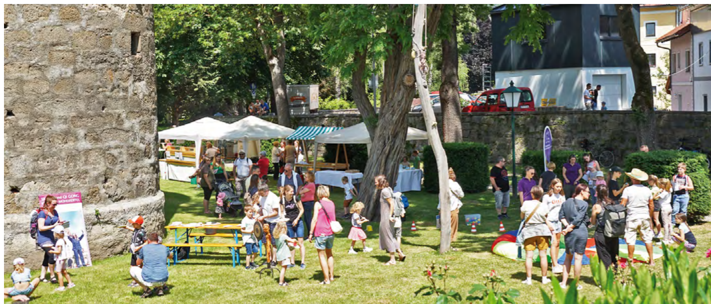
Am 15. Juni findet das große Bewegungsfest der Gesunden Gemeinde statt.

Sport, Spiel und Spaß am 15. Juni im Stadtgraben