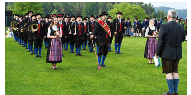
Am 1. Juni zeigen mehr als 30 Kapellen am Freistädter Messegelände ab 13.30 Uhr ihr Marschier-Talent.

Um 19 Uhr finden sich alle teilnehmenden Kapellen vor der Messehalle zum traditionellen Gesamtspiel ein, bevor mit allen Musikern und Gästen gefeiert wird. Die Stadtkapelle Freistadt lädt alle Freistädterinnen und Freistädter sehr herzlich ein, das Ambros-Konzert sowie das Bezirksmusikfest zu besuchen und das 75-Jahr-Jubiläum des Musikvereins mitzufeiern.