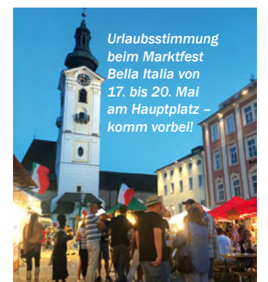
Urlaubsstimmung beim Marktfest Bella Italia von 17. bis 20. Mai am Hauptplatz – komm vorbei!

Das zweite kulinarische Highlight des Wochenendes findet am Samstag und Sonntag in der Messehalle statt. Beim ersten Mühlviertler BBQ-Festival zeigen nationale und internationale Aussteller alles rund ums Thema Grillen, BBQ und Genuss. Wir freuen uns auf verschiedene Grill- und Saucen-Wettbewerbe, Grillstars, Wettessen, Kinderprogramm und vieles mehr.