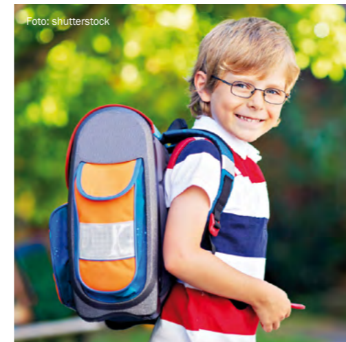
Neben dem neuen Kinderbetreuungszentrum stehen die Erweiterung der Volksschulen und die Sanierung der Badeanlage ganz oben auf der Prioritätenliste.

Mehr als 3.200 Kinder und Jugendliche gehen aktuell in Freistadt zur Schule oder besuchen eine Betreuungseinrichtung und es werden laufend mehr. Da wundert es nicht, dass neben den Kindergärten auch die Volksschulen bald an die Grenzen ihrer Platzkapazitäten stoßen. Deren Ausbau steht daher neben dem neuen Kinderbetreuungszentrum ganz oben auf der Prioritätenliste der Gemeinde.