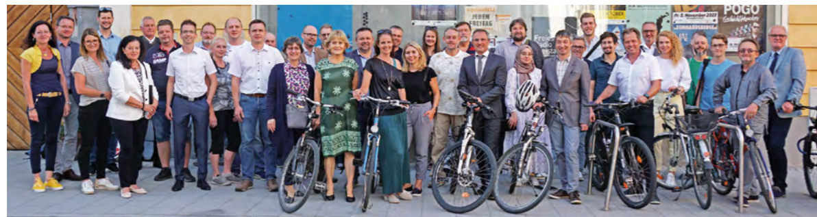
Zur jüngsten Gemeinderatssitzung erschienen die Mandatäre geschlossen mit dem Rad oder zu Fuß.

Zur letzten Sitzung kam der Gemeinderat geschlossen zu Fuß oder mit dem Rad