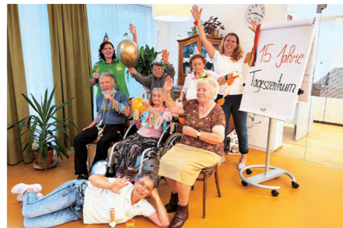
Ein herzliches Miteinander und humorvolle gemeinsame Stunden: Im Tageszentrum sind ältere, betreuungsbedürftige Menschen gut aufgehoben. Am 13. Oktober wird Geburtstag gefeiert – kommen Sie vorbei und feiern Sie mit!