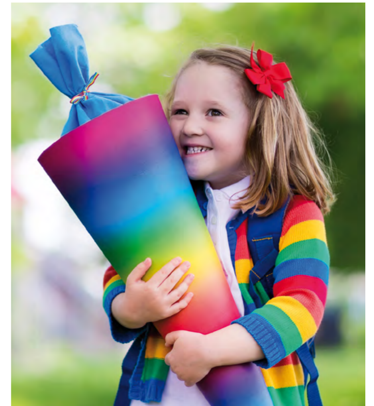
Wir wünschen einen guten Start ins neue Schul- und Kindergartenjahr!

„Mit der Professionalisierung der Ganztageschule durch das OÖ Hilfswerk haben wir in diesem Schuljahr eine weitere großartige Neuerung“, so die Stadträtin. Ab sofort übernimmt das OÖ Hilfswerk an den Volksschulen 1 und 2 sowie an der Musikmittelschule die Früh- und Mittagsaufsicht, die Schulassistentenstunden sowie die Nachmittagsbetreuung, wir berichteten ausführlich in der letzten Ausgabe. Die bestehenden Mitarbeiterinnen wurden übernommen. Das OÖ Hilfswerk führt rund 350 Kinderbetreuungseinrichtungen in ganz Oberösterreich und verfügt über langjährige Erfahrung und hohe Expertise.