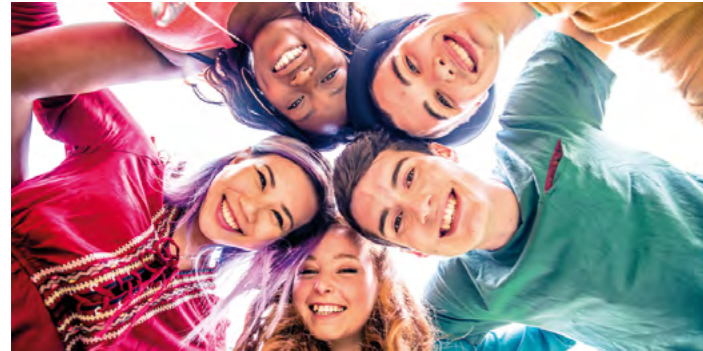
Lerne die Angebote für die Freistädter Jugend kennen: am 16. September von 13 bis 20 Uhr am Areal der ÖTB-Halle.

Samstag, der 16. September, steht ganz im Zeichen der Jugend. Von 13 bis 20 Uhr gehört die ÖTB-Halle mit dem dazugehörigen Freiareal den Jugendlichen. Die Gemeinde veranstaltet in Kooperation mit vielen Vereinen und Jugendorganisationen einen bunten und informativen Nachmittag. „Wir laden alle Jugendlichen sehr herzlich ein, unsere Vereine kennenzulernen, Aktivitäten auszuprobieren, sich auszutauschen und zu vernetzen. Vielen Dank an alle, die das tolle Programm mitgestalten“, so Jugendstadtrat Clemens Poissl.