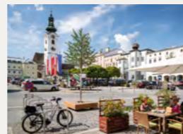
Jetzt für unsere klimafitten Hauptplatz abstimmen!

Wie in der letzten Ausgabe berichtet, sind wir mit unserem klimafitten Hauptplatz für einen grenzüberschreitenden Klima-Preis nominiert. Die „Adaptterra Awards“ holen die besten Klimawandelanpassungsprojekte im österreich-tschechischen Grenzgebiet vor den Vorhang. Wir sind bereits in der Endrunde und brauchen nun Ihre Unterstützung: Bis 15. Oktober können Sie unter www.adaptterraawards.eu Ihre Stimme für unsere Schwammstadt abgeben. Das Projekt mit den meisten Stimmen wird zum Sieger gekürt. Vielen Dank für Ihre Unterstützung!