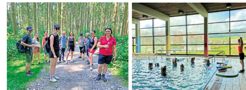
Sportliche Aktivitäten im Team der Stadtgemeinde: gemeinsame Wanderung auf den Braunberg und Aquafitness im Hallenbad.