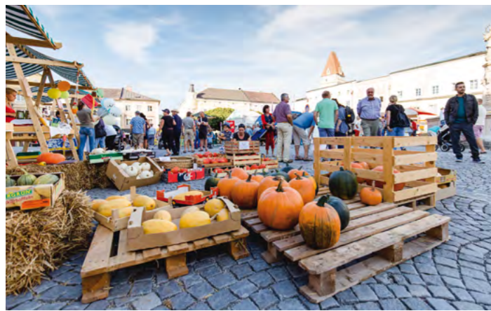
Von Hokkaido bis Butternuss: Am 15. September ist der Kürbis der Star in der Innenstadt.

Am 15. September heißen wir den Herbst willkommen!