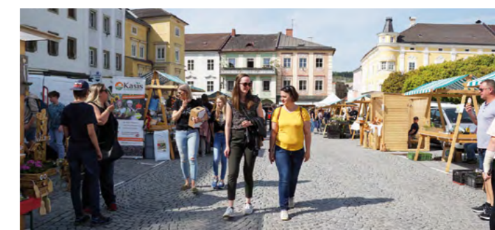
Mit dem Pflanzmarkt am 26. April läuten wir die Marktsaison ein.

Um 16 Uhr wird die Genussfreitags-Saison mit dem Bieranstich offiziell eröffnet. Höhepunkt des Tages ist die Angelobung von 400 Rekruten um 18 Uhr, bei der auch der „Große Österreichische Zapfenstreich“ gespielt wird. Anschließend lädt das Bundesheer zu Kostproben aus der Feldküche. Ab 20 Uhr spielt die Pop & Rock-Formation der Militärmusik OÖ „Camouflash“ am Hauptplatz.