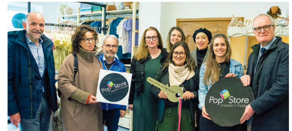
Drei Frauen, ein Geschäft: Im PopUp Store „kids conceptstore & friends“ gibt es hochwertige Kindermode, Spielwaren, Schmuck, Anlassgeschenke, Papeterie, individuelle Mode uvm.

Das charmante Geschäft in der Samtgasse 5 ist ab April wieder frei. Es bietet auf 50m 2 Raum für neue Geschäftsideen. Eine Möblierung ist vorhanden. „Du hast eine besondere Geschäftsidee? Ein Produkt, das unbedingt unter die Leute gehört? Dann melde dich noch heute und wir unterstützen dich bei deinem Start in unserem PopUp Store in Freistadt!“, lädt Leerstandsmanagerin Christa Kreindl vom Stadtmarketing ein.