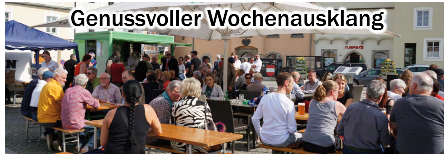
Genussfreitag am Hauptplatz: von Ende April bis Ende September jeden Freitag ab 11.45 Uhr – komm vorbei!