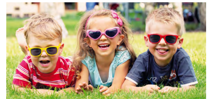
Die Gemeinde bietet wieder die Ferienbetreuung „Spielesommer“ für Kinder zwischen 3 und 12 Jahren an.