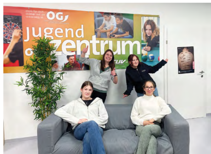
Erster Mädeltag im neuen Jugendzentrum! Die Premiere sorgte für Begeisterung, einmal monatlich wird es nun einen Girls Day geben.

Positive Bilanz nach den ersten vier Monaten – schau auch du vorbei!