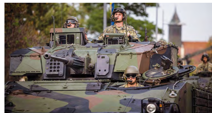
Beim Tag des Bundesheeres am 3. Mai gibt es eine Fahrt mit dem Panzer zu gewinnen.

Eingeläutet wird die Marktsaison mit dem traditionellen Pflanzmarkt am 26. April. Die offizielle Eröffnung mit Bieranstich findet eine Woche später, am 3. Mai, beim Tag des Bundesheeres statt. Die 4. Panzergrenadierbrigade lädt anlässlich ihres 60-jährigen Bestehens zur großen Leistungsschau mit Angelobung von ca. 400 Grundwehrienern.