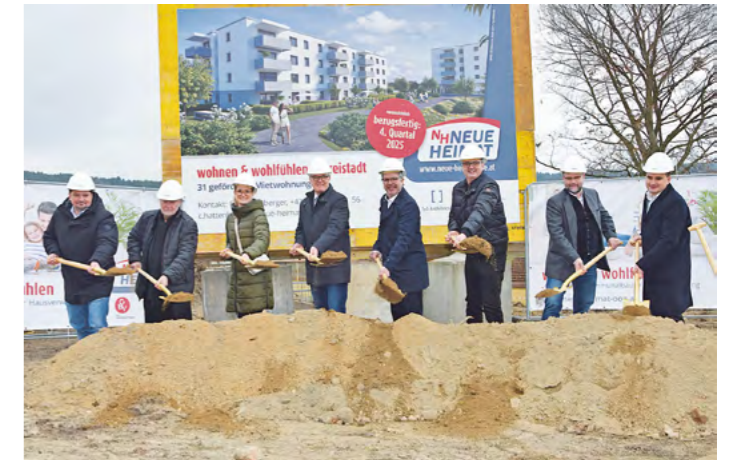
Spatenstich für den ersten Wohnblock beim Mehr-Generationen-Projekt in der Zemannstraße. Im Herbst soll der Baustart für das neue Kinderbetreuungscenter erfolgen.

Mit dem betreuten Wohnen im alten Krankenhaus in unmittelbarer Nachbarschaft werden auf diesem Areal künftig drei Generationen Tür an Tür leben und wertvolle Zeit verbringen. „Mit