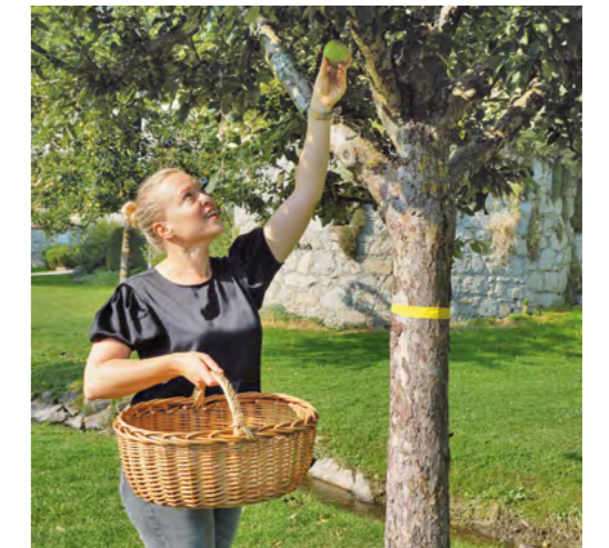
An gelb markierten Obstbäumen darf sich jeder bedienen. Lassen Sie es sich schmecken!

Achtung: Es dürfen ausschließlich markierte Bäume abgeerntet werden und jeder, der Obst erntet, macht dies auf eigene Gefahr.