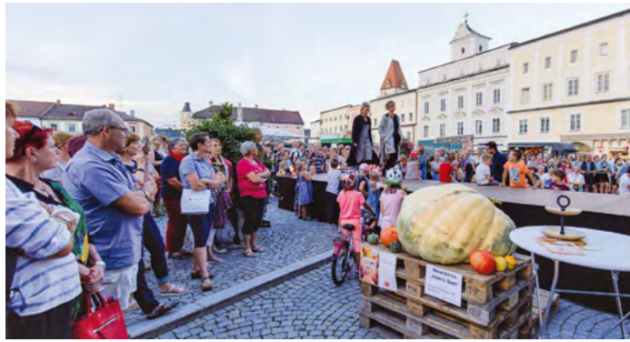
Die traditionelle Trachtenmodenschau wird heuer um 17.30 Uhr mit einer Parade durch die Stadt beginnen.