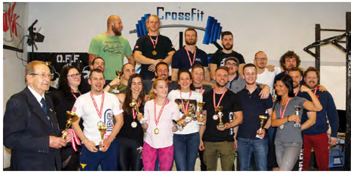
Ein erfolgreiches Team! Bei der heurigen Staatsmeisterschaft haben die Athleten des ASKÖ Freistadt – KSV Outdoor Fitness Heimvorteil.