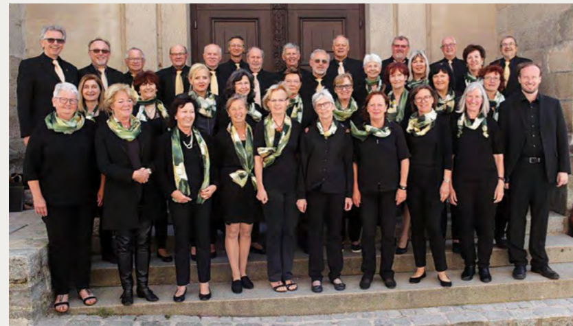
170 Jahre und kein bisschen müde – die Chorgemeinschaft freut sich auf den musikalischen Höhepunkt im Jubiläumsjahr.