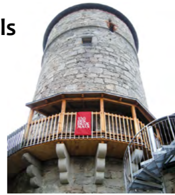
Am 29. September kann der Scheiblingturm zwischen 10 und 17 Uhr bestiegen werden.

Kirchturmbesteigung mit Besuch der Türmerstube Besteigung Scheiblingturm