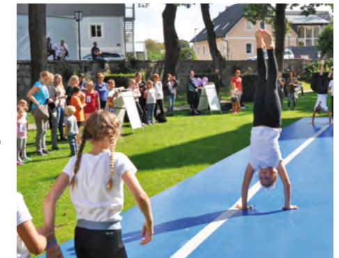
Freuen Sie sich auf beeindruckende Vorführungen der Sport-Union Turnen um 14:15, 15:15 und 16:15.

Ein herzliches Dankeschön an das tolle Team der Gesunden Gemeinde und alle Helferinnen und Helfer, die diesen Nachmittag mitgestalten!