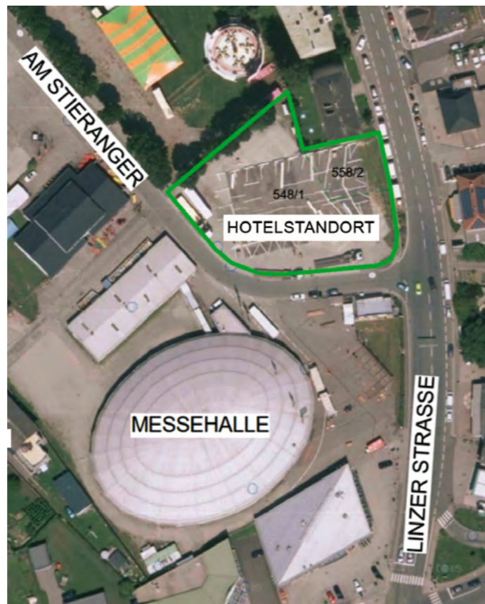
Auf dem derzeitigen Parkplatz schräg gegenüber der Messehalle könnte ein Hotel entstehen. Den Interessenten wurde ein zweijähriges Optionsrecht eingeräumt.

Um dem Investor das nötige Maß an Planungssicherheit geben zu können, hatte der Gemeinderat eine grundsätzliche Entscheidung zu treffen: Will man an diesem Standort ein Hotel oder nicht. Mit großer Mehrheit (35 Pro-Stimmen, 2 Enthaltungen) bekannte sich der Gemeinderat zur Verwirklichung eines Hotelprojektes am derzeitigen Parkplatz schräg gegenüber der Messehalle und beschloss mehrheitlich, den Interessenten ein zweijähriges Optionsrecht für den Kauf der erforderlichen Grundstücke zu einem gutachterlich festgelegten Preis einzuräumen.