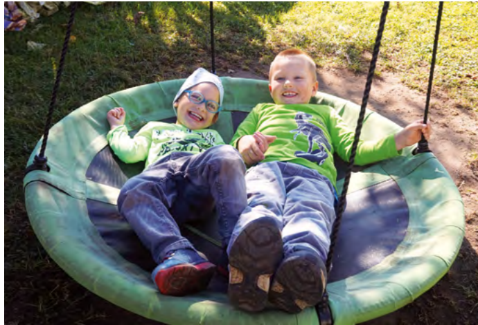
Gelebtes Miteinander im integrativen Kindergarten der Lebenshilfe! Kinder mit und ohne Beeinträchtigung werden hier liebevoll und professionell in ihrer Entwicklung begleitet.

In Sachen Kinderbetreuung ist Freistadt eine Vorzeigestadt. Das beweist die Bewertung im Kinderbetreuungsatlas der Arbeiterkammer OÖ, wo Freistadt ein „1A“ erhalten hat. Damit gehört die Bezirksstadt zu den 20 Prozent der Gemeinden in Oberösterreich, deren Betreuungsangebot vorbildlich ist. 1A-Gemeinden haben verschiedene Kriterien zu erfüllen. Unter anderem muss der Kindergarten mindestens 45 Stunden in der Woche geöffnet sein, davon an vier Tagen mindestens 9,5 Stunden, im Jahr darf er maximal fünf Wochen geschlossen sein. „Kinder sind unsere Zukunft. Eine gute Betreuung und frühe Förderung gehören zu unseren wichtigsten Aufgaben“, ist Bürgermeisterin Elisabeth Paruta-Teufer überzeugt. „Wir versuchen bestmöglich auf die Bedürfnisse unserer Familien einzugehen und investieren sehr viel Geld in die Betreuung und Bildung unseres Nachwuchses.“