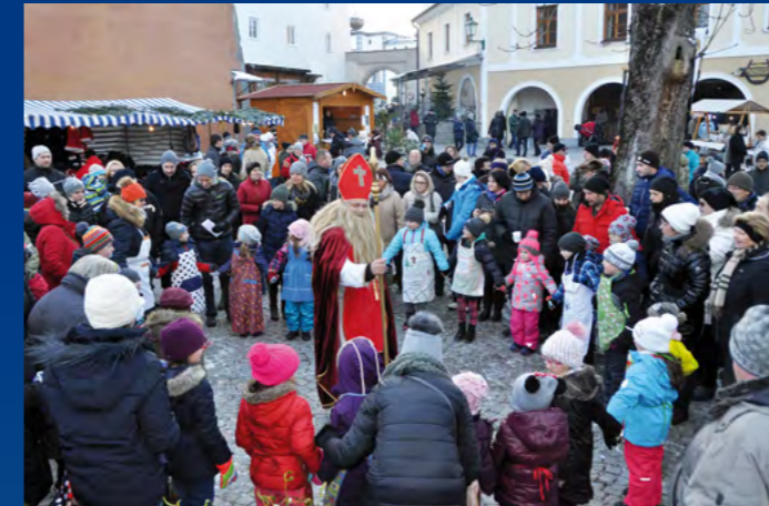
Der Nikolaus zu Besuch am Christkindlmarkt im Schlosshof.

Märkte, Ausstellungen, Spaziergänge, Konzerte und andere Treffpunkte in der besinnlichsten Zeit des Jahres