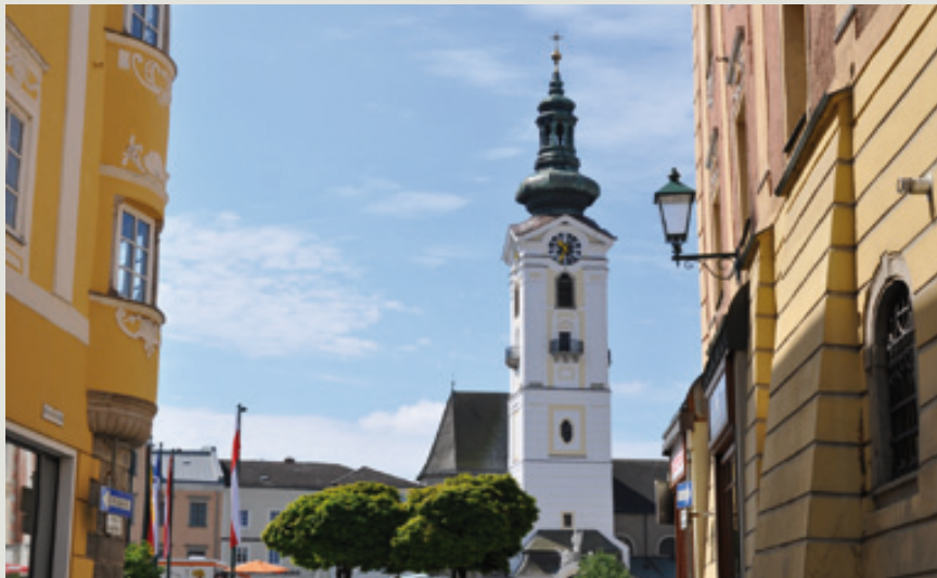
Als historisches Stadtjuwel mit zeitgemäßen, modernen Standards, so wird sich Freistadt bereits Ende dieses Jahres den Bewohnern und Besuchern präsentieren.

Vor allem dann, wenn die Grabungsarbeiten in einigen Altstadtgassen beginnen, weil dort neue Wasser-, Strom- und Fernwärmeleitungen verlegt werden. Und zu temporären Behinderungen wird es sicher auch auf dem Hauptplatz kommen, wenn die großflächigen Pflasterarbeiten beginnen.