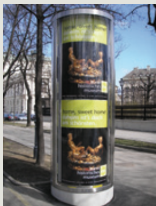
So sollen die neuen Litfasssäulen auf dem Hauptplatz aussehen und die vielen, hässlichen Plakatständer ersetzen, die das Stadtbild seit Jahren verunzieren.

Am deutlichsten kommt die optische Fitnesskur auf dem Hauptplatz zum Tragen. Er soll wieder belebtes Stadtzentrum werden