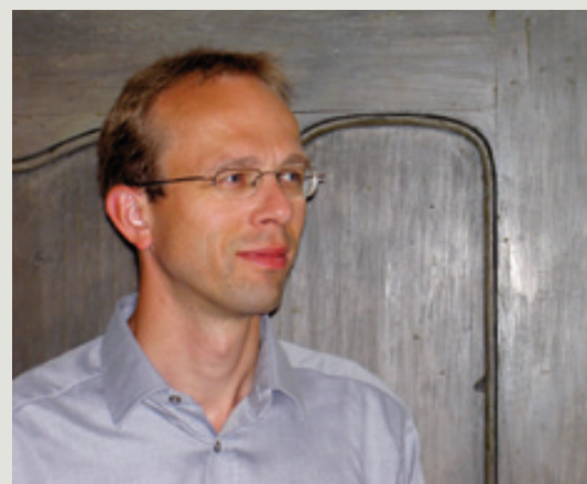
Das Modell des neuen Freistädter Hauptplatzes stammt von Architekt Herbert Pointner, der schon bei vielen Stadtverschönerungsprojekten seine Stilsicherheit bewiesen hat.

Statt der bislang 86 wird es auf dem Hauptplatz künftig 90, großzügig bemessene Parkplätze mit 2.70 Metern Breite geben. Ihre Anordnung bleibt, wie schon im Probetrieb getestet, senkrecht.