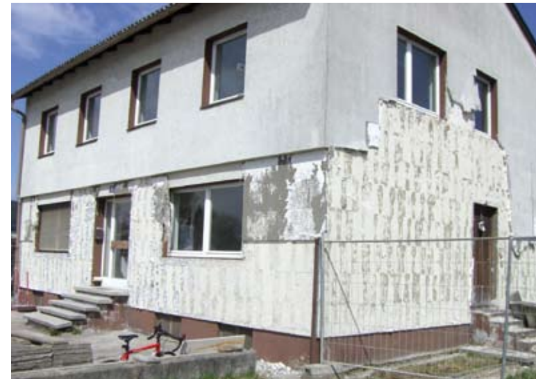
Bürogebäude an der Leonfeldner Straße vor und nach der sieben-monatigen Umbauzeit