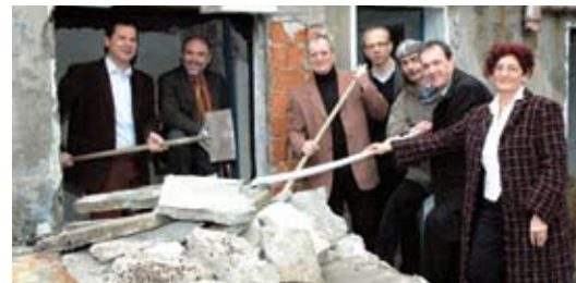
Spatenstich am 22. April 2008

Impressum: Herausgeber, Verleger und Medieninhaber: Stadtgemeinde Freistadt, Hauptplatz 1, 4240 Freistadt Für den Inhalt verantwortlich: Stadtgemeinde Freistadt Erscheinungsort und Verlagspostamt: 4240 Freistadt Gestaltung: upart Werbung & Kommunikation GmbH Druck: Plochl Druck GmbH, Freistadt „Aktuell aus dem Rathaus“ ist das offizielle Informationsmedium der Stadtgemeinde Freistadt. Grundlegende Richtung des Mediums ist die gemeindepolitische, lokale, wirtschaftliche und kulturelle Information über die Stadtgemeinde Freistadt.