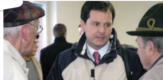
In vielen „runden Tischen“ mit Anrainern wurde um Zustimmung geworben