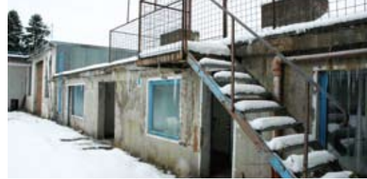
Ein Blick zurück