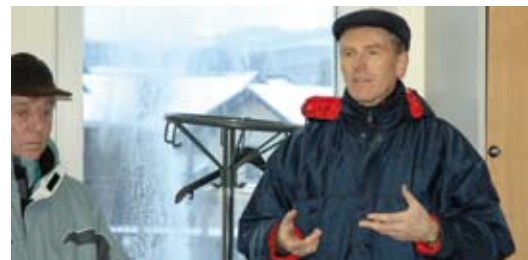
Auf Fragen folgten Antworten, aus Skepsis wurde Verständnis