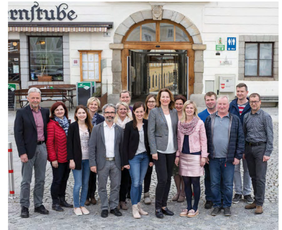
Dem Rathaus-Team steht ein turbulenter Baustellen-Sommer bevor. Wir bitten um Verständnis, wenn es während der Bauzeit im Rathaus ein wenig lauter zugeht. Ihre Anliegen werden wir weiterhin rasch und kompetent bearbeiten.

Anfang Juli sollen die Umbauarbeiten im Rathaus starten. Sie umfassen die energetische Sanierung durch Fenstertausch und Dämmung der Dachgeschossdecke und den Umbau des dritten Stockwerkes sowie eines Teils des Dachgeschosses. Gleichzeitig müssen verschiedenste Brandschutzmaßnahmen im gesamten Haus umgesetzt werden. Die Gesamtbaukosten liegen bei ca. 1,3 Mio. Euro.