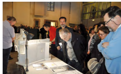
Mehr als 100 Bürgerinnen und Bürger kamen zur öffentlichen Präsentation und staunten über die Ideen der Architekturstudenten.

Die 17 Studenten hatten sich ein Semester lang intensiv mit unserer Innenstadt beschäftigt, mit Bewohnern und Akteuren gesprochen und Zukunftsprojekte erarbeitet, die sie am 8. März der Öffentlichkeit präsentierten. Im Anschluss hatten die Besucher die Möglichkeit, Punkte für ihre Lieblingsprojekte zu vergeben. Folgende Architekturideen für Freistadt haben es unter die Top 5 geschafft: Fr(eis)tadt – Eislaufen im Stadtgraben, Kultur_m – Rekonstruktion des niedergebrannten Salzhofurmes, Spiegelstadt – Pop-up-Store am Hauptplatz mit verspiegelten Außenwänden, Hoch hinaus – Kleine Hotelzimmer, die über der Stadt zu schweben scheinen, und HARRESIAREKIN BAT – Mit der Stadtmauer verbunden – ein Weg entlang der Stadtmauer mit verschiedenen Stationen. Alle Projekte waren auch in Linz öffentlich ausgestellt.