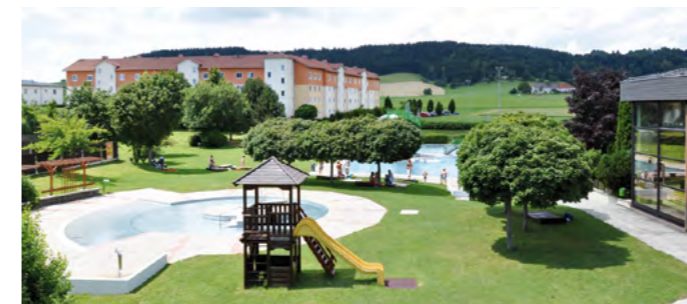
Lange dauert es nicht mehr, bis die Freibadsaison beginnt: Wenn das Wetter mitspielt, am 17. Mai!

Baderatten aufgepasst! Wenn der Wettergott mitspielt, öffnet das Freibad am 17. Mai seine Pforten. Das Hallenbad hat jedenfalls bis zum Muttertag (13. Mai) geöffnet, bei Schlechtwetter noch ein bis zwei Wochen länger. Ab Beginn der Freibadsaison ist die Saunawelt eingeschränkt in Betrieb: jeden Dienstag, Freitag und Samstag von 15 bis 21 Uhr. Das Freibad hat wochentags von 10 bis 19 Uhr und an Samstagen, Sonn- und Feiertagen sowie während der Sommerferien täglich von 9 bis 20 Uhr (ab Mitte August bis 19 Uhr) geöffnet. Unsere Eintrittspreise: Tageskarte für Erwachsene € 3,60, für Kinder € 1,70. Vergünstigungen gibt es mit der Familienkarte, für Pensionisten, Schüler, Lehrlinge, Studenten, Präsenz- und Zivildienstler sowie behinderte Personen. Eine Saisonkarte kostet für Erwachsene € 61 und für Kinder € 31.