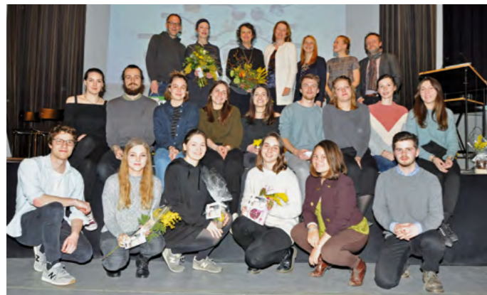
Kreative Köpfe mit tollen Ideen für Freistadt! Diese 17 Studenten der Kunstuni Linz entwickelten originelle Architekturprojekte für unsere Innenstadt.