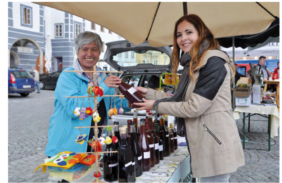
Selbst gemachte Säfte und Marmeladen, Gemüse aus eigenem Anbau und vieles mehr gibt es jeden Freitagnachmittag beim Genussmarkt am Hauptplatz zu kaufen.