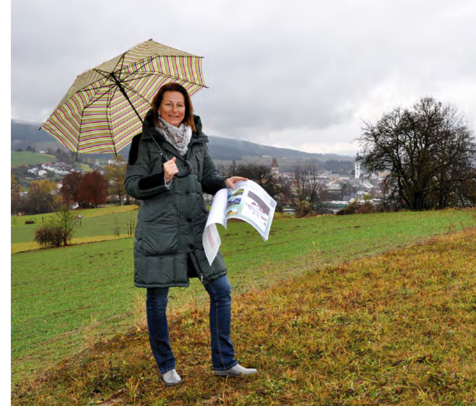
Vom Hotelstandort eröffnet sich ein fantastischer Blick auf unsere wunderschöne Stadt.