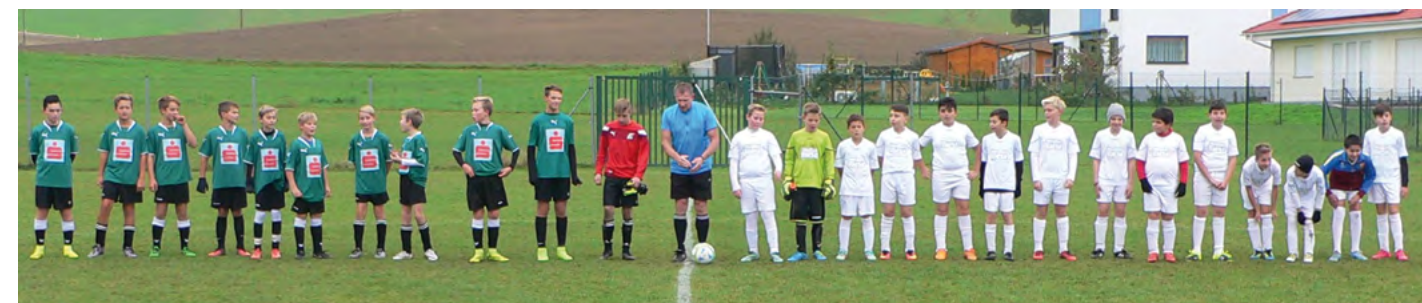
Gleich im ersten Spiel trafen die Jungkicker der NMS Freistadt auf den Titelverteidiger: die NMS Pregarten.

Seit mehr als 15 Jahren hat Freistadt keine Mannschaft mehr in der Fußball-Schülerliga gestellt. Durch die Zusammenlegung der beiden öffentlichen Mittelschulen fanden sich heuer erstmals wieder genügend interessierte Talente, sodass die NMS Freistadt einen Neueinstieg in den Meisterschaftsbetrieb wagte. Wir wünschen viel Erfolg und freuen uns auf viele tolle Spiele!