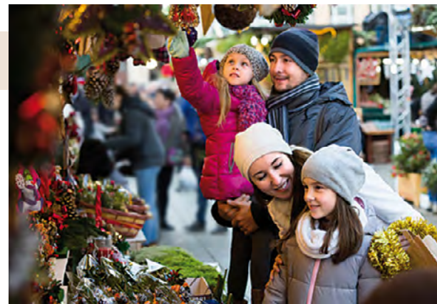
Adventgestecke, Weihnachtsbäckerei und frische Zutaten für das Weihnachtsmenü gibt es im Advent am Bauernmarkt zu kaufen.

Der Bauernmarkt am Freistädter Hauptplatz hat einfach immer Saison. Auch jeden Samstag im Advent werden zwischen 8 und 12 Uhr frische, regionale Lebensmittel sowie bauerliches Kunsthandwerk angeboten.