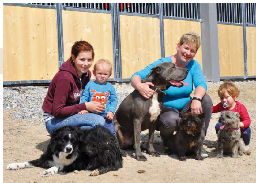
Familie Binder lädt am 1. Oktober zur offiziellen Eröffnung der neuen Tierunterkunft. Feiern Sie mit!

Den ganzen Tag über: Tierheimbesichtigung, große Hüpfburg für Kinder, Kinderprogramm