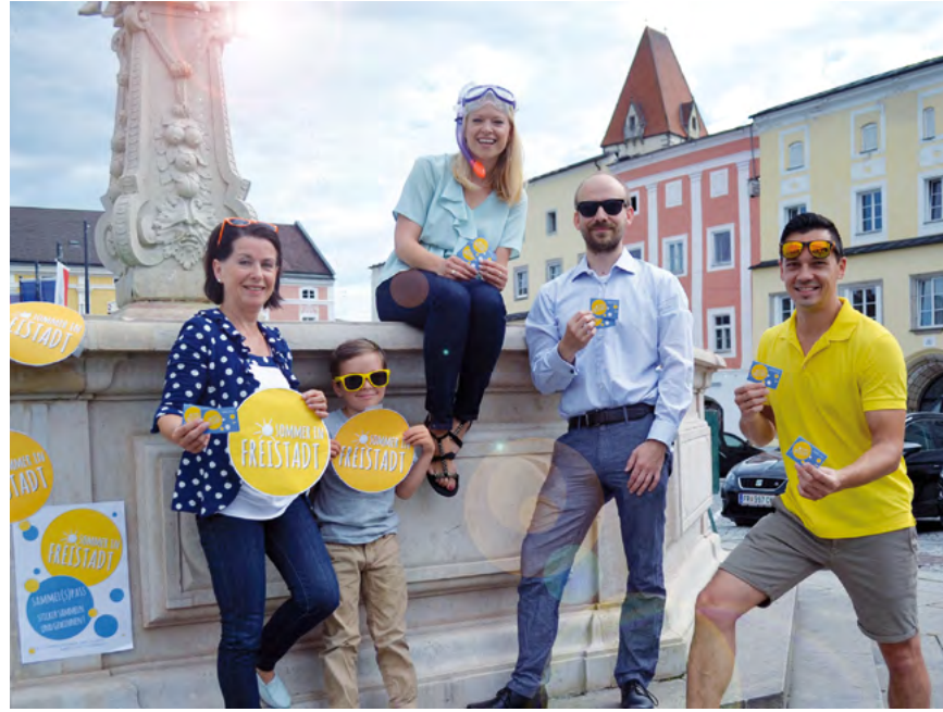
Der Verein Pro Freistadt lädt zum Sammelspaß in der Innenstadt ein.