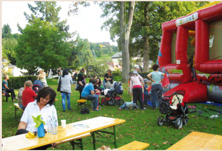
Ob in der Hüpfburg, beim Minigolf oder beim Sackhüpfen – freuen Sie sich auf einen Nachmittag voller Abenteuer!