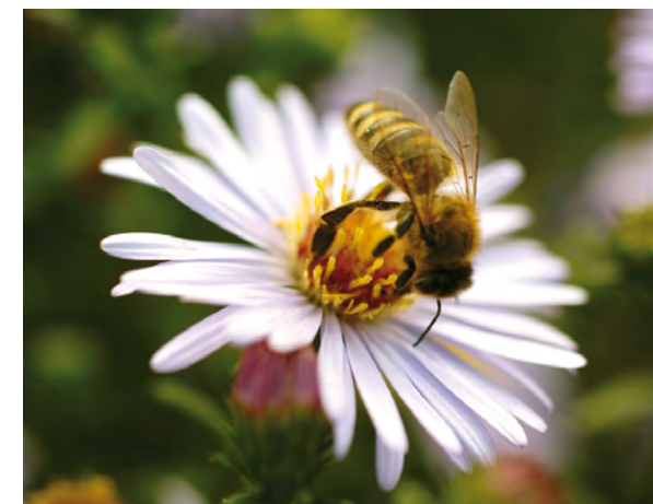
Nicht so entwickelt, wie erhofft, haben sich die angelegten Bienenweiden und Blühstreifen auf Gemeindeflächen. Für die nächsten Jahre sind neue Maßnahmen geplant.