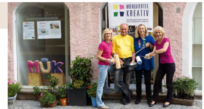
Voller Einsatz! Für das Kernteam des Vereins Mühlviertel Kreativ gibt es bis zur Eröffnung des offenen Kulturhauses am 1. Oktober noch viel zu tun.

Bis zur Eröffnung am 1. Oktober hat der Trägerverein Mühlviertel Kreativ noch viel zu tun. Auf Flohmärkten wird nach gebrauchten Möbel Ausschau gehalten und kleinere bauliche Adaptierungen sind noch zu bewältigen. Wer das kreative Projekt unterstützen möchte, kann bei der Bausteinaktion mitmachen. Für jeden, der einen Betrag von € 20,- auf das Vereinskonto überweist (IBAN: AT56 2032 0321 0024 4098), liegt ab 1. Oktober im MÜK eine Kunstkartenbox als Dankeschön bereit. Das MÜK hat von Mittwoch bis Samstag täglich von 10 bis 18 Uhr geöffnet.