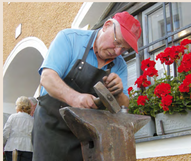
Ein Highlight beim Tag des Denkmals am 25. September: Schauschmieden in der alten Schmiede – ab 13 Uhr.

Zu einer kulturgeschichtlichen Reise auf historischen Wegen und Straßen lädt der diesjährige österreichweite Tag des Denkmals am 25. September ein. Unter dem Motto „Gemeinsam unterwegs“ stehen heuer Pilgerwege, Handelsstraßen, Kellergassen, Themenwege sowie die Straßen- und Schienenbaukunst im Mittelpunkt des Interesses.