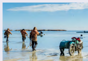
Der Film I SOGNI DEL LAGO SALATO wurde mit dem Dokumentarfilmpreis der Stadt ausgezeichnet.