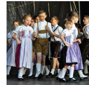
Ein Höhepunkt am Mühlviertler Herbstfest: der Auftritt der Kinder-Volkstanzgruppe.

Freistadt feiert am 16. September ein Fest der Vielfalt mit kulinarischen, handwerklichen und musikalischen Beiträgen aus verschiedenen Teilen der Welt. Beim Mühlviertler Herbstfest präsentieren Künstlerinnen und Künstler des Vereins Mühlviertel Kreativ und aus Krumau ab 13 Uhr ihr Kunsthandwerk in der Innenstadt. Die Bioregion Mühlviertel und die Genussmarkt-Ständler verwöhnen die Gäste mit hochwertigen Produkten und Schmankerln aus der Region. Ein buntes Programm gibt es auch für die jüngsten Gäste: Eine Mal- und Bastelwerkstatt, Kinderschminken, Glücksrad und Stadtrallye, Bummelzugfahrten, ein Streichelzoo sowie Flying-Boards im Stadtgraben sorgen für Spaß und Unterhaltung.