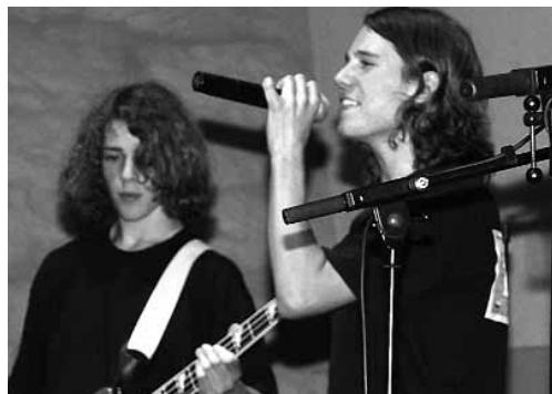
Die Freistädter Jugendtage - was hier zählt sind Kreativität und Vielfalt!

M enschen, die von einer Sache begeistert sind, stecken auch andere mit ihrer Begeisterung an. So auch in Freistadt.