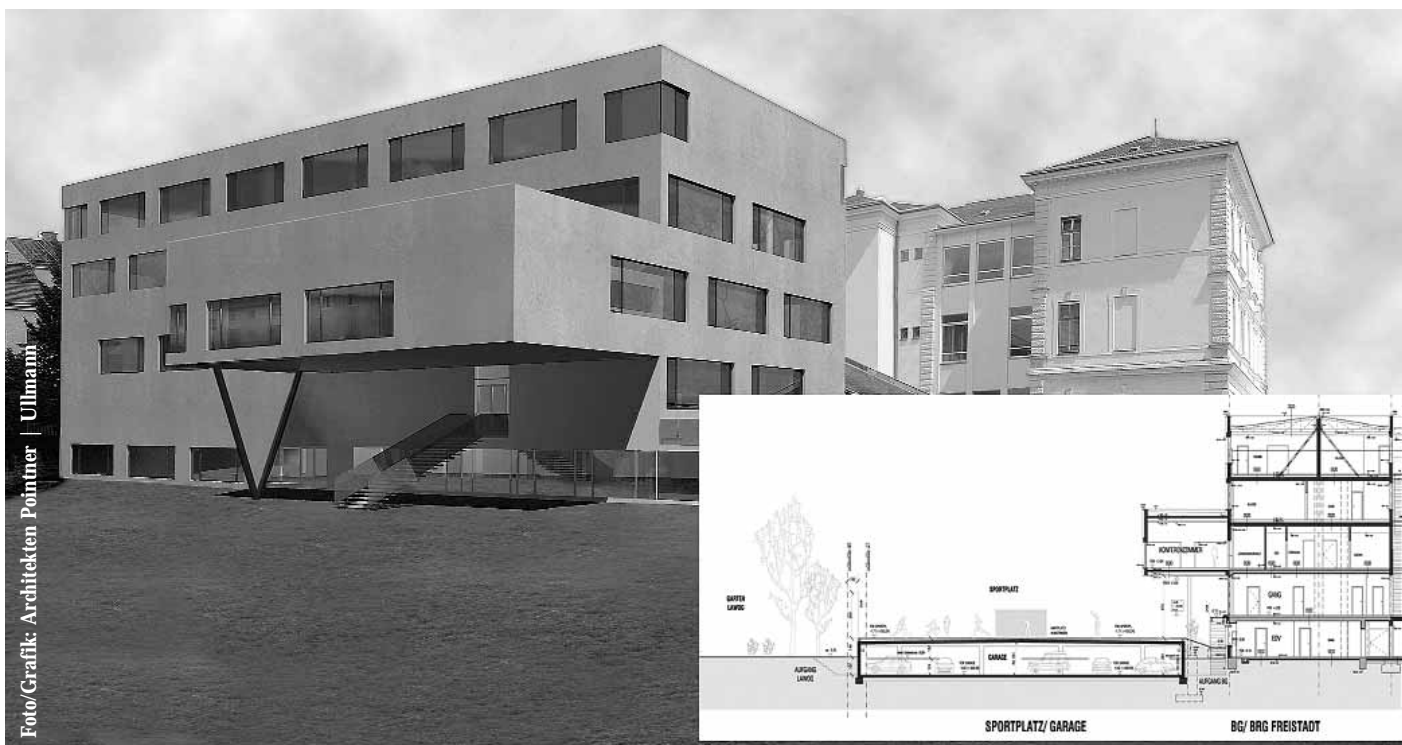
Der Neubau des Gymnasiums mit der geplanten Tiefgarage.