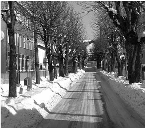
Die Allee wird erhalten, muss aber verjüngt werden

Die Entscheidung, etliche der alten Kastanien der Brauhausallee fallen zu müssen, ist mir und den anderen Mitgliedern des Stadtrates nicht leicht gefallen. Aber die Sicherheit - insbesondere der im Bereich der Brauhausallee verkehrenden vielen Schulkinder - ist einfach wichtiger als alle anderen Argumente. Mir ist bewusst, dass diese Entscheidung möglicherweise viele