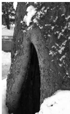
Morsch, löchrig und innen komplett hohl sind viele alten Stämme - nur eine Frage der Zeit, wann ein Baum umstürzt!

Daher: mit der Entfernung jener Bäume, die nach langem Siechtum zunehmend zu